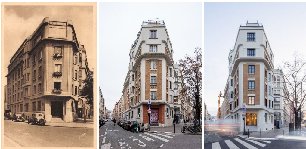
L'immeuble en 1930 en 2019 puis en 2023.

Idéalement situé au 81, avenue de la République dans le 11 ème arrondissement de Paris, dans un quartier en plein renouveau, à proximité immédiate des stations de métro Rue Saint-Maur et Ménilmontant, ce bâtiment de 6 étages déploie 2192 m 2 de surface de plancher ainsi qu'un rooftop avec une vue imprenable sur Paris. L'immeuble a été conçu en 1922 puis réalisé en 1926.