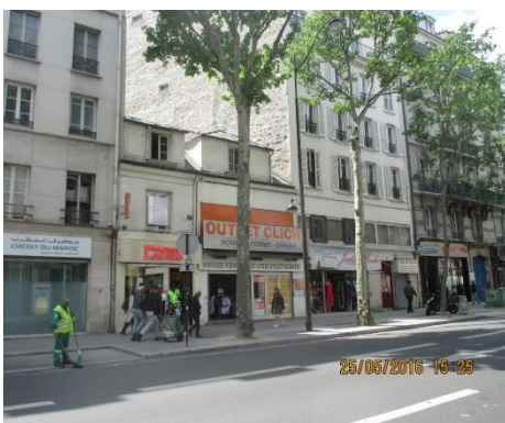
L'emplacement avant les travaux de recyclage urbain

Conformément à ses engagements d'entreprise à mission, Novaxia a renaturé 130 m 2 sur une parcelle de 500 m 2 , afin de permettre le retour de la nature en ville grâce à un jardin alimenté en eau de pluie, réalisé par le paysagiste Les Jardins de Gally. Le bâtiment est équipé en panneau solaire pour l'eau chaude sanitaire. Ce projet a été financé par l'épargne de particuliers, qui ont investi dans un fonds de recyclage urbain de Novaxia Investissement. Les fonds présentent des risques, notamment en perte de capital et de liquidité.